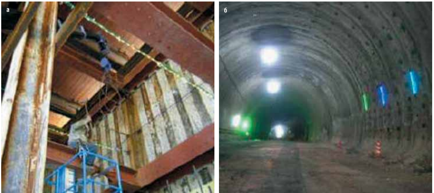
Рис. 3. Автоматизированный мониторинг напряженно-деформированного состояния строительных конструкций с постоянным оповещением о безопасности при помощи световых индикаторов (светодиодов): а – при разработке котлованов; б – при проходке тоннелей

Запланировано 270 сверхдлинных тоннелей общей протяженностью 3 834 км, среди которых 19 тоннелей с длиной тоннеля более 20 км и общей протяженностью 465 км.